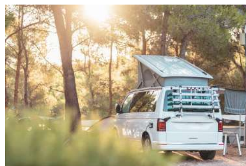
Part des vans et fourgons dans les immatriculations annuelles :